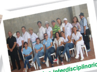
Actual Equipo Interdisciplinario