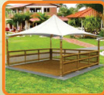
KIOSKO ICG - FUSIÓN