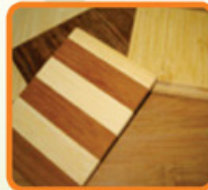
VIGAS Y TABLEROS ESTRUCTURALES