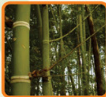
MATERIA PRIMA GUADUA